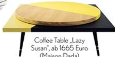
Coffee Table „Lazy Susan“, ab 1665 Euro (Maison Dada)

Wandfarben „Amalfi Lemon“, „Polished Cement“ und „Dianthus Pink“, je 78 Euro/2,5 Liter (Designers Guild)