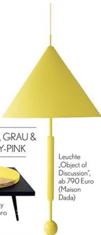
Leuchte „Object of Discussion“, ab 790 Euro (Maison Dada)