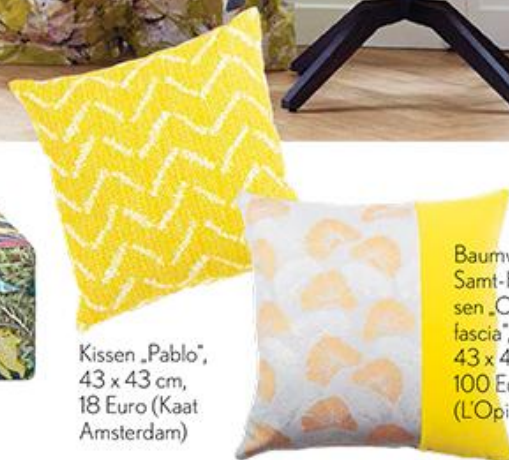
Kissen „Pablo“, 43 x 43 cm, 18 Euro (Kaat Amsterdam)