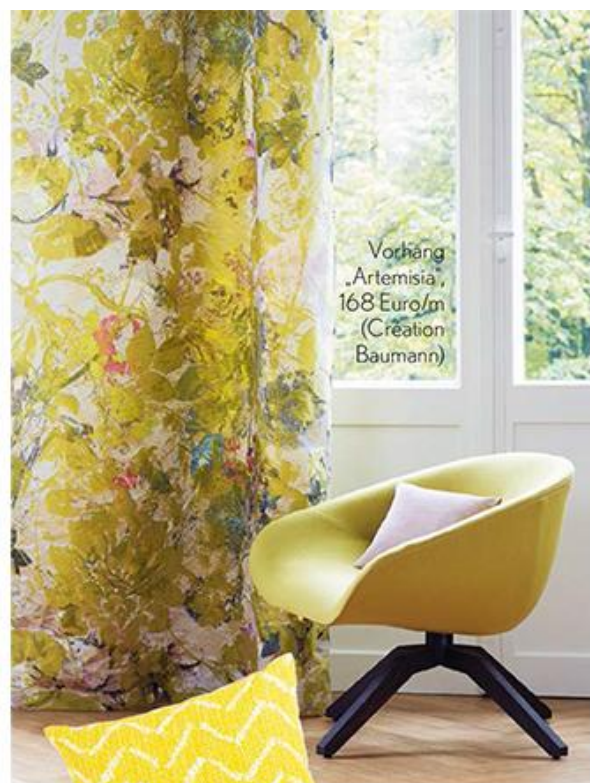
Vorhang „Artemisia“, 168 Euro/m (Creation Baumann)