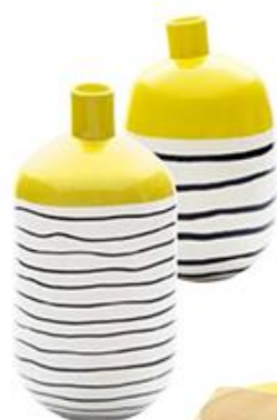
Vasen „Bouteille Royan“, ab 220 Euro (TH Manufacture)