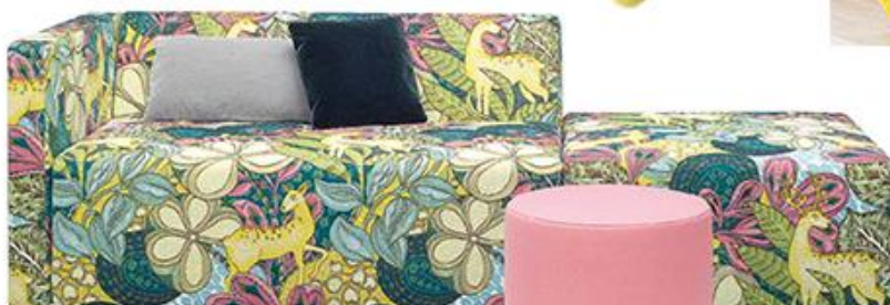
Sofa „Kerman“, 223 x 85 x 72 cm, mit Pouf-Modul, ab 5110 Euro (E15)