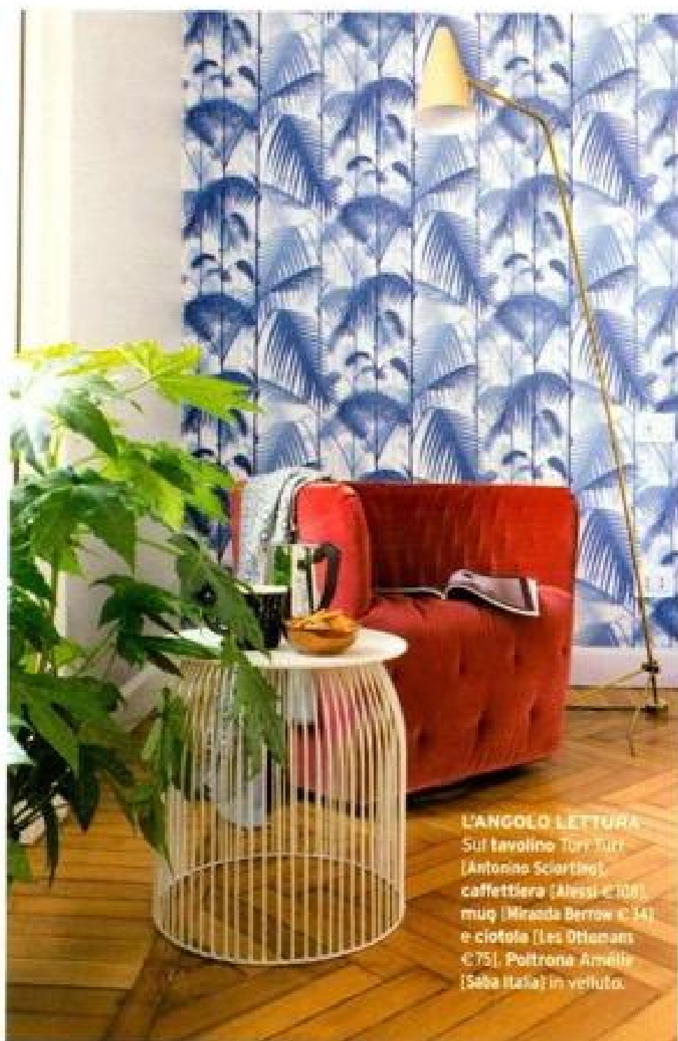
L'ANGOLO LETTURA Sul tavolino Tori Tori (Antonio Sciortino), caffettiera (Alessi €108), mug (Minzola Berrow €14) e ciotola (Les Otoman €75). Poltrona Amélie (Saba Italia) in velluto.